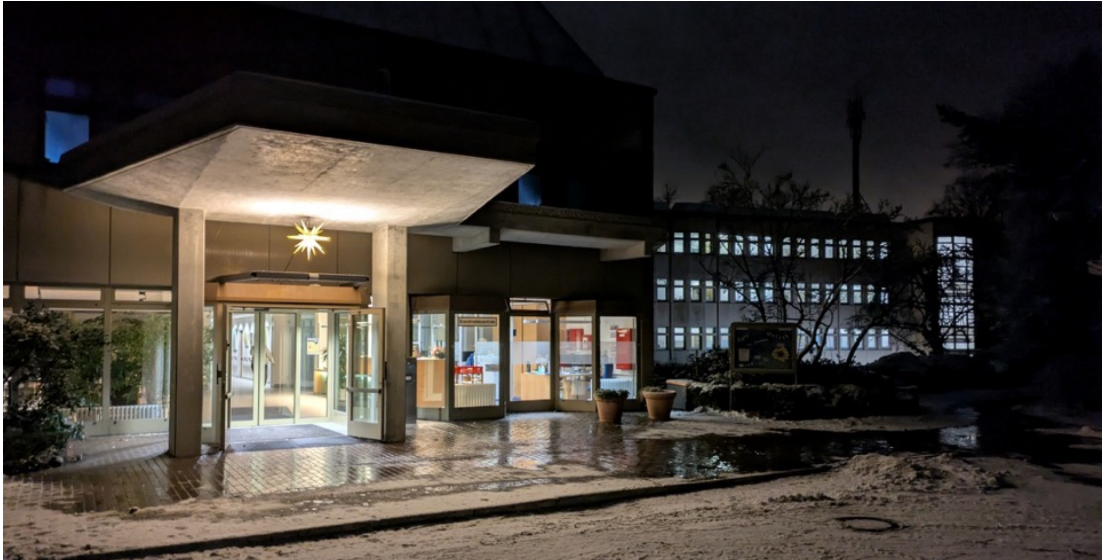
Eine Insel mit Licht