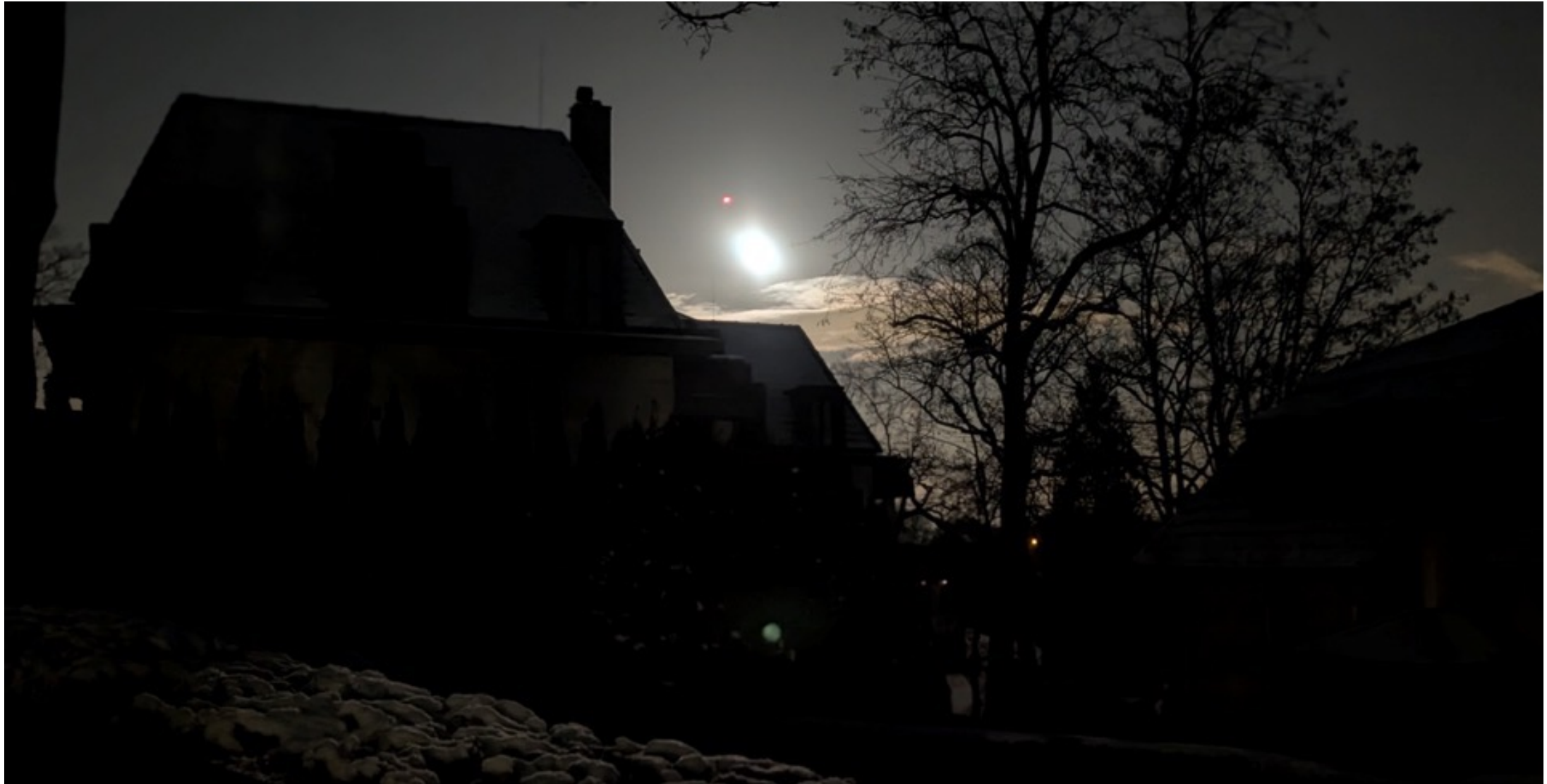
Wannsee im Dunklen