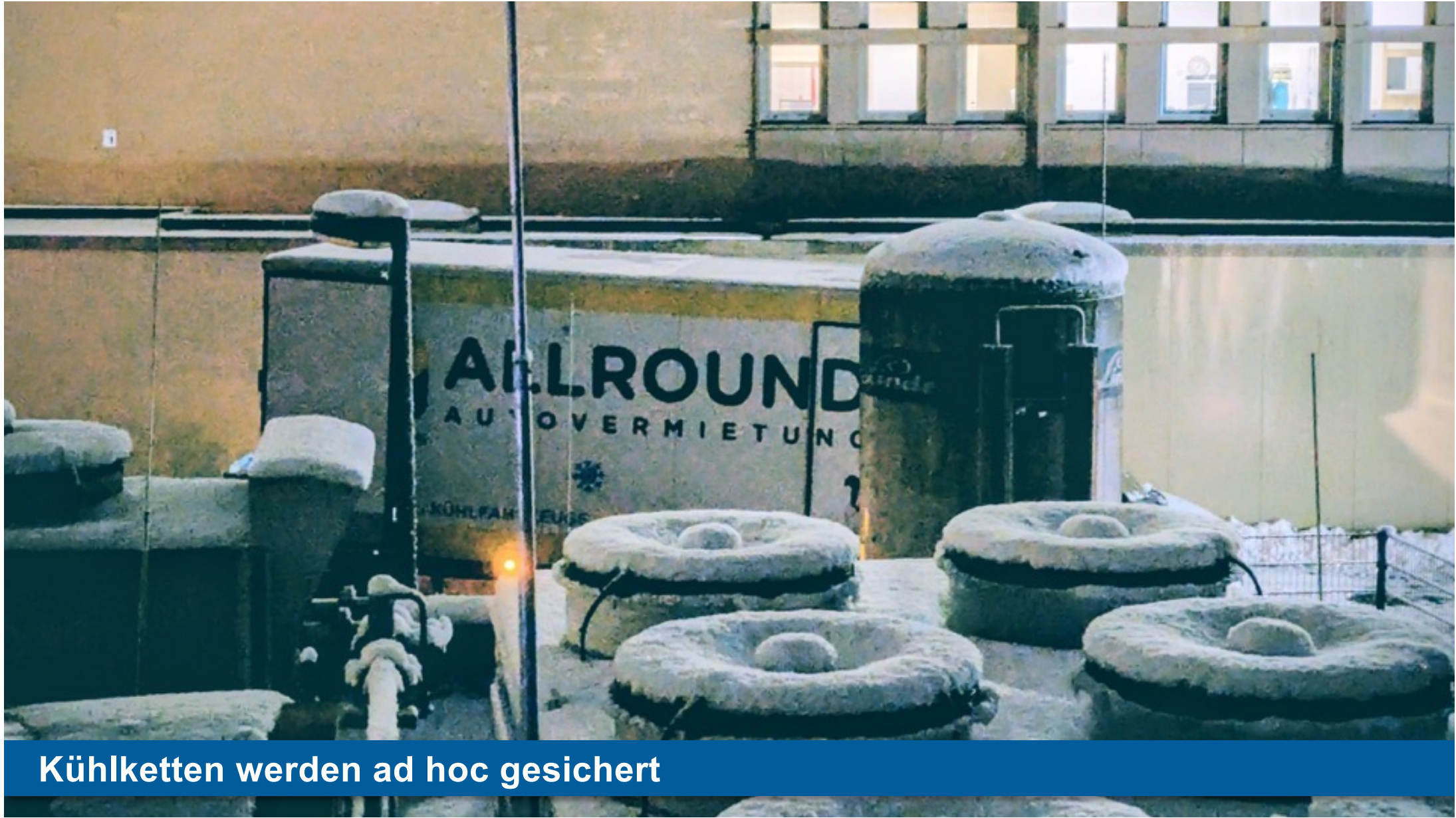
Kühlketten werden ad hoc gesichert