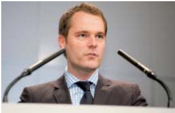
Der Parlamentarische Staatssekretär im BMG, Daniel Bahr, während seiner Eröffnungsansprache beim 32. Deutschen Krankenhaustag am 18. November 2009 in Düsseldorf.