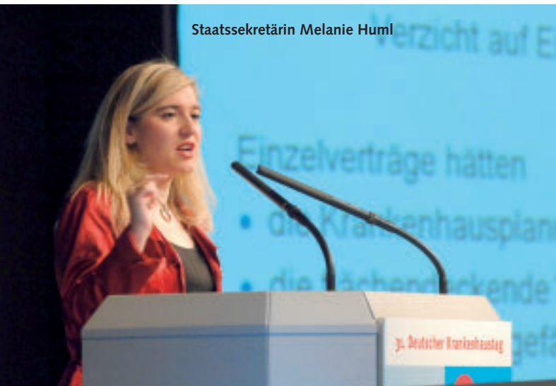
Staatssekretärin Melanie Huml